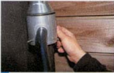
8 雨水コレクターミニの下部を付属の木ネジで固定する