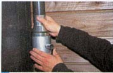
6 上部をおろして下部にしっかりとめ込む