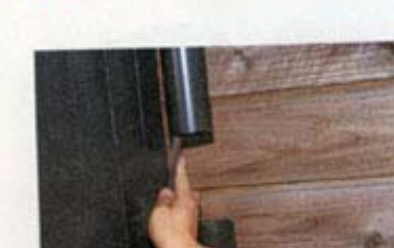
4 トイの切り口の内側をヤスリで削る。これは雨水コレクターミニを接続をやすくするため