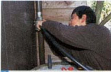
7 ホースを雨水コレクターミニの出水部に取りつける