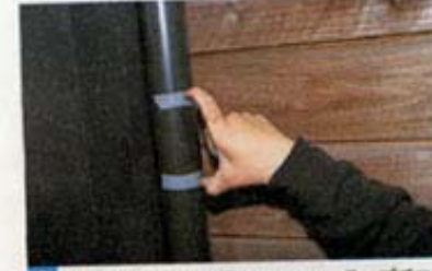
2 切断する雨トイの長さは120mm。テープでマーキングした