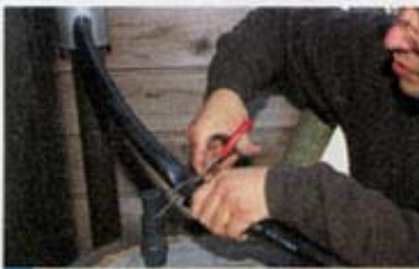
9 ホースの長さを決めて、ホースを切る