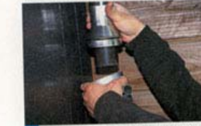
5 雨水コレクターミニの上部を先に上のトイにはめ、少し上にずらしておき、フィルター部をはめ込んだ下部を下のトイにはめる