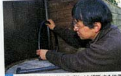
1 ホースを仮に当てながら縦トイを切断する位置を決める