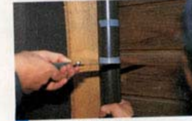
3 ノコギリでトイを切断する