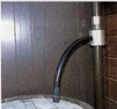
10 雨トイと樽が連結された