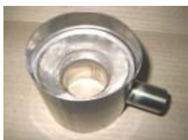
下部と内部フィルター