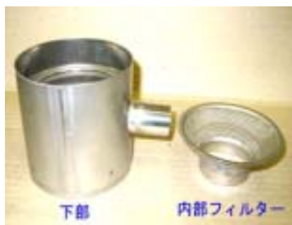
下部 内部フィルター