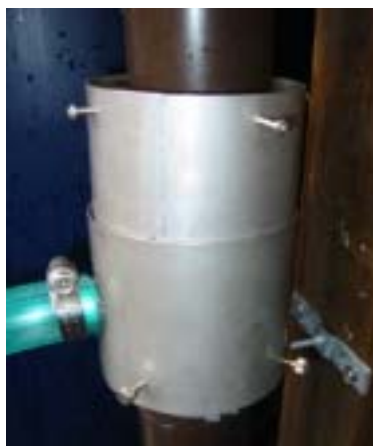
マルチ対応型上部