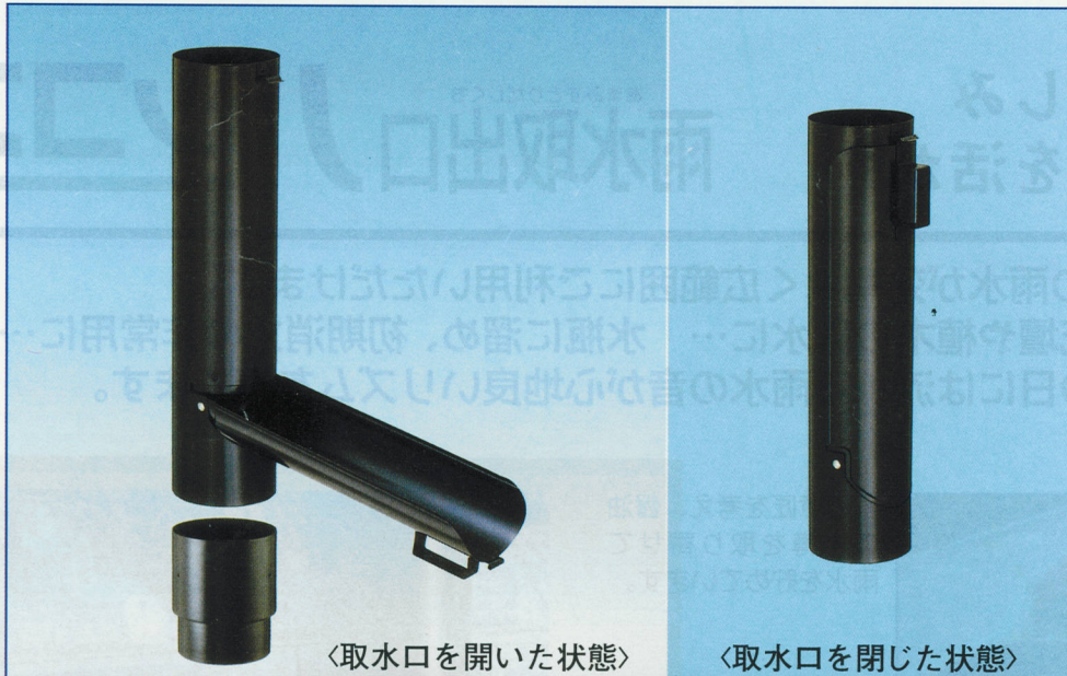
〈取水口を開いた状態〉