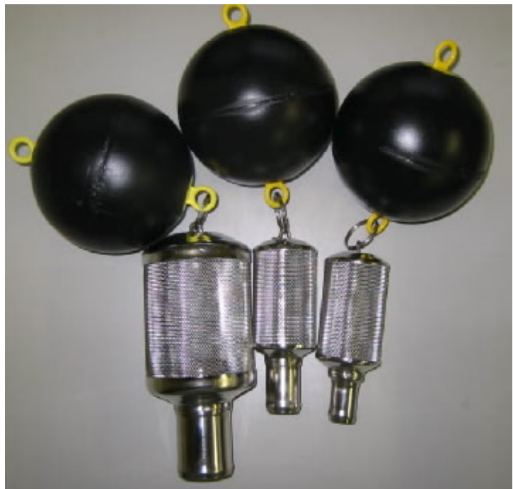
メッシュが1.2ミリ間隔のSAGFタイプ