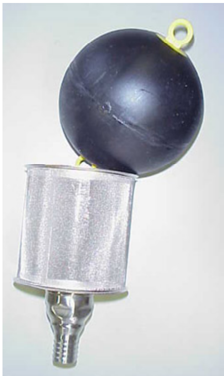
メッシュが0.23ミリ間隔のSAFFタイプ

雨水コレクターでゴミを分離しても、長い年月とともに土砂が雨水タンクに沈殿していきます。またタンク表面には花粉、油分などが浮くことがございます。浮き球を浮かべ、水面直下の水を取水することで、いつも良質な水をつかることが可能となります。